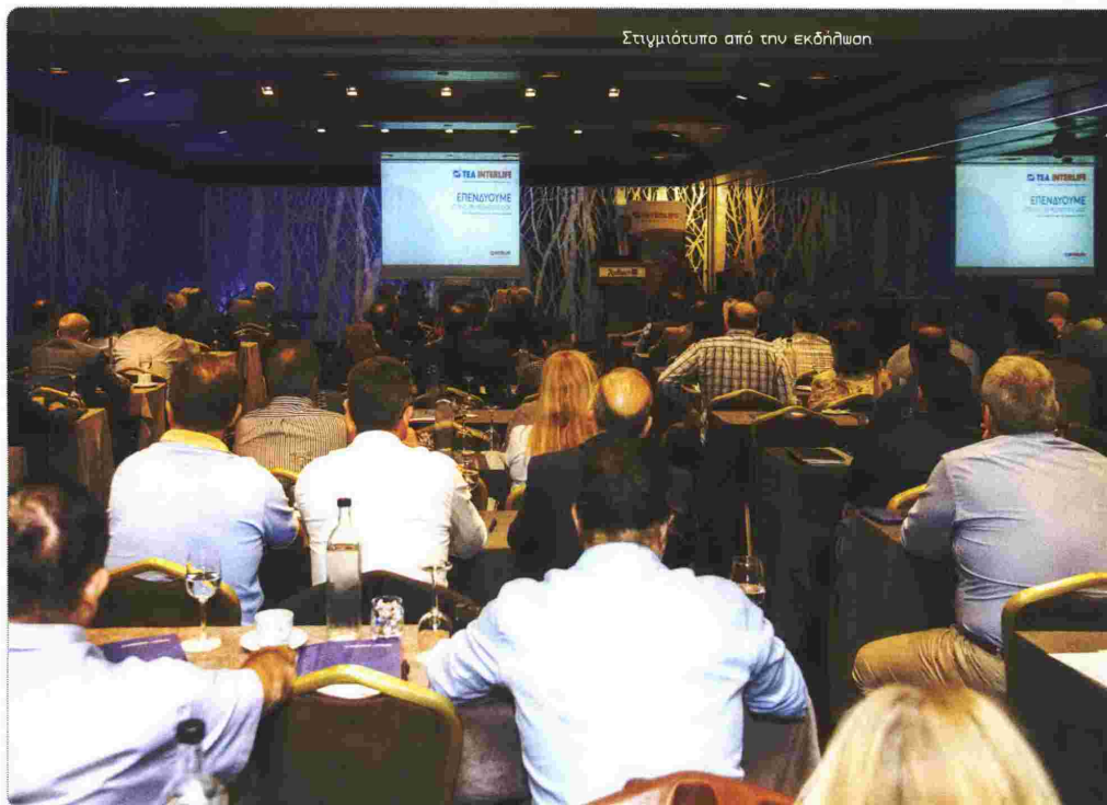
Στιγμιότυπο από την εκδήλωση