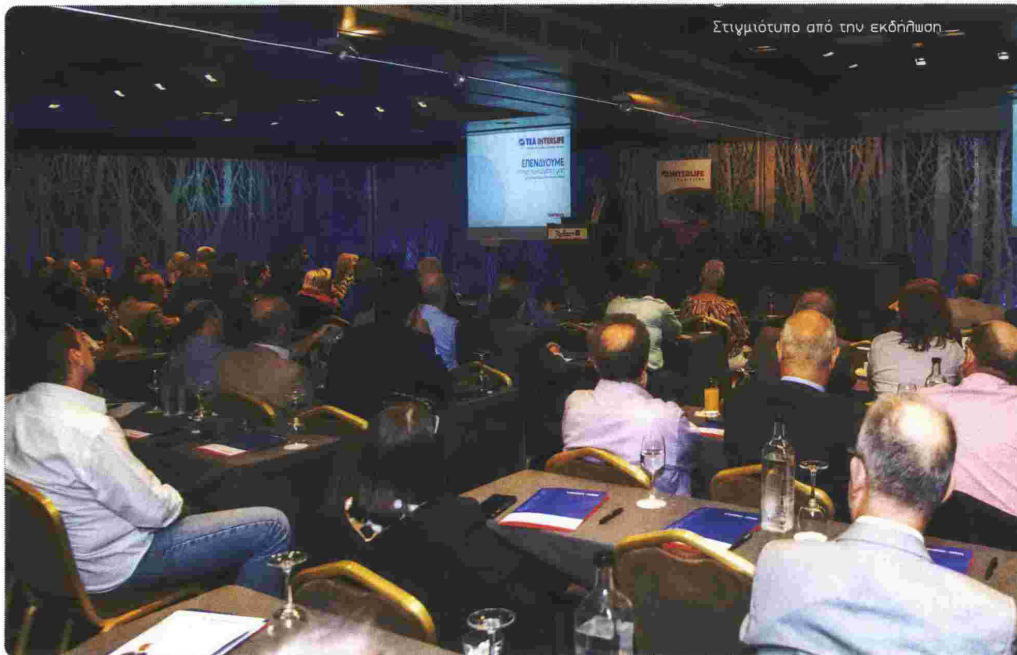
Στιγμιότυπο από την εκδήλωση

Ας έρθουμε τώρα στο TEA Interlife. Το όλο εγχείρημα της οργάνωσης και της διαχείρισης των λειτουργιών του TEA έχει ανατεθεί στην εταιρεία συμβουλευτικών υπηρεσιών Prudential Informatics, η οποία προσφέρει ολοκληρωμένα πληροφοριακά συστήματα διαχείρισης του κύ-