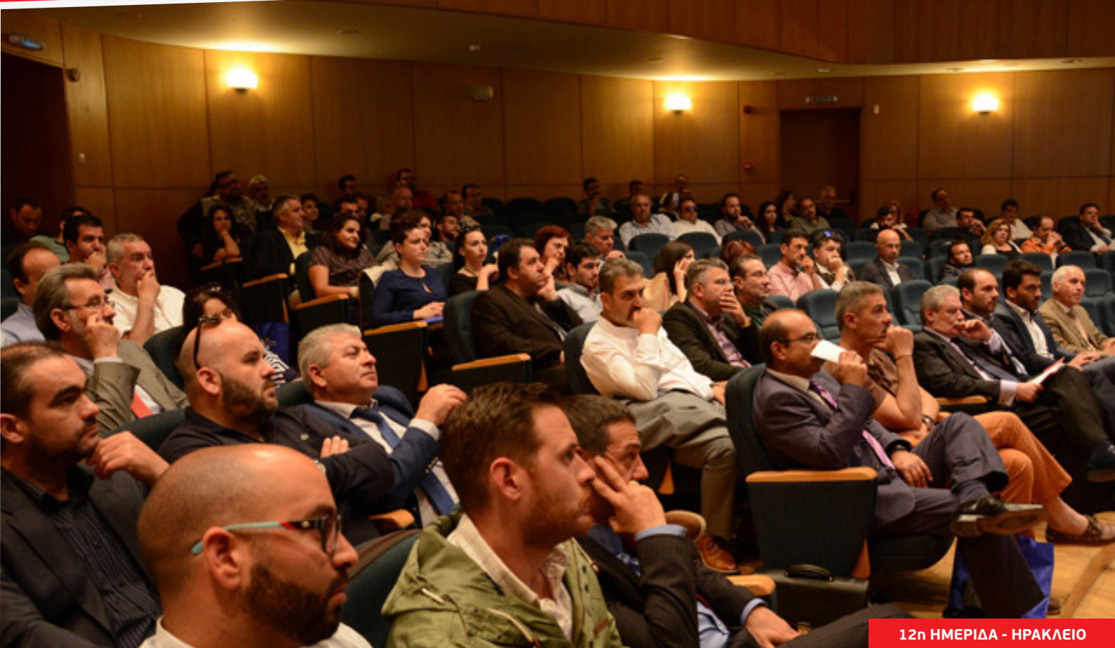
12η ΗΜΕΡΙΔΑ - ΗΡΑΚΛΕΙΟ