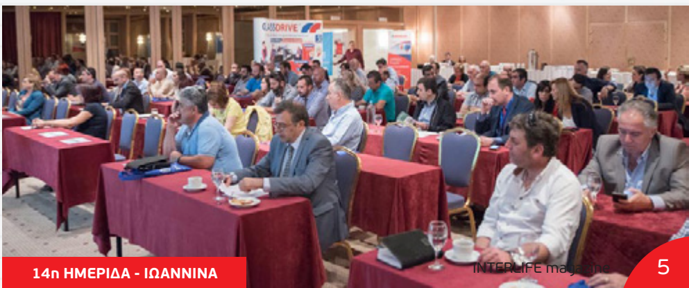
14η ΗΜΕΡΙΔΑ - ΙΩΑΝΝΙΝΑ