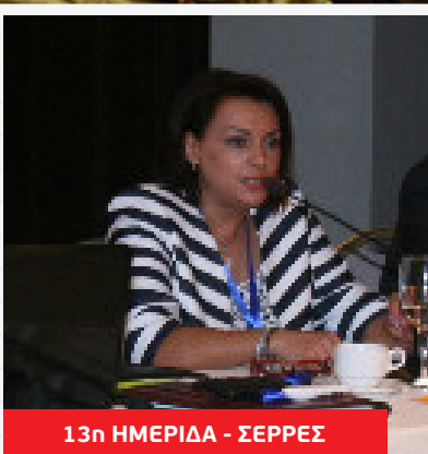
13η ΗΜΕΡΙΔΑ - ΣΕΡΡΕΣ