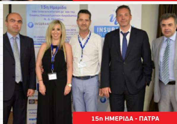
15η ΗΜΕΡΙΔΑ - ΠΑΤΡΑ