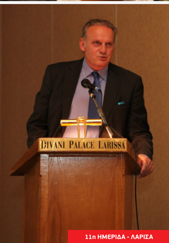
11η ΗΜΕΡΙΔΑ - ΛΑΡΙΣΣΑ