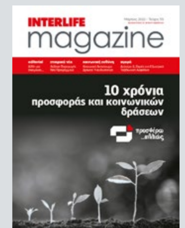
Περιοδική Έκδοση της INTERLIFE Ασφαλιστικής