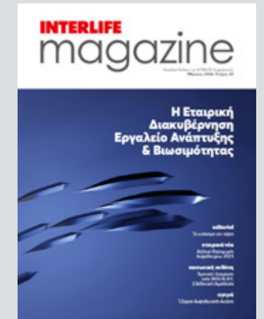
Περιοδική Έκδοση της INTERLIFE Ασφαλιστικής