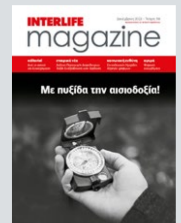
Περιοδική Έκδοση της INTERLIFE Ασφαλιστικής

Τι μας επιφυλάσσει το μέλλον Επενδυτική ματιά στο 2023